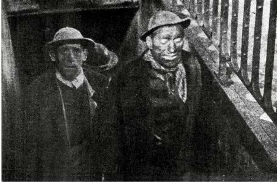
وجوه مغبرة خارجة من المصنع.

هذه كلها وغيرها مما لم نذكر أسباباً أثارت القلق والاضطراب والشك في كل شيء مما عده اشبنجر وغيره مظاهر للتدهور.