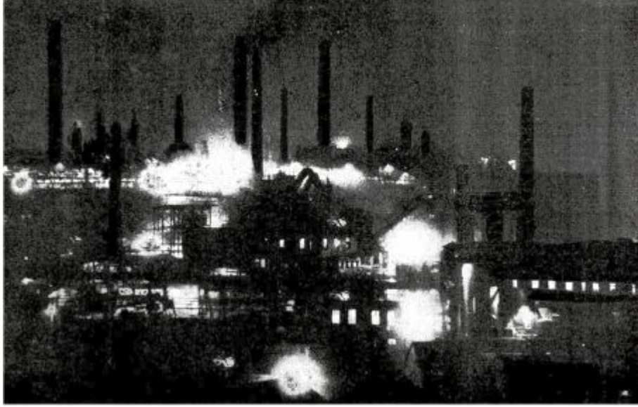
المصانع ... عماد مدنفة الغرب.

ولم يكن هذا أمرًا طبيعيًا حتى يدوم، ففي الشرق حدث أن ثارت الشعوب ضد الاستعمار، ومدتهم هذه الثورة بأسباب الكفاح: نشاطًا بعد خمول، وقوة بعد ضعف، وأملًا بعد يأس.